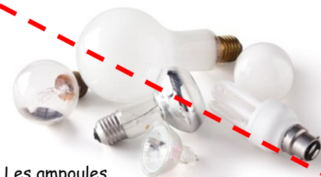
Les ampoules d'éclairage ou lampes