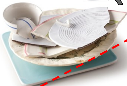
La vaisselle en porcelaine, la faïence