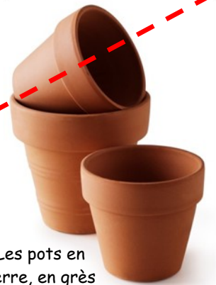
Les pots en terre, en grès