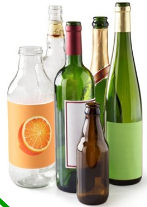
Bouteilles en verre transparent et teinté