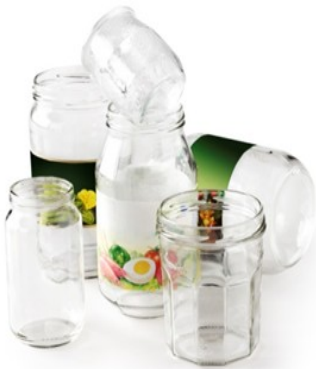
Bocaux et pots en verre