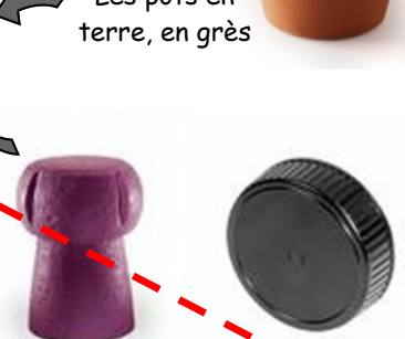
Les capsules et bouchons