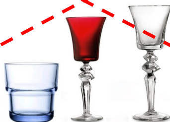
Les verres culinaires, en cristal