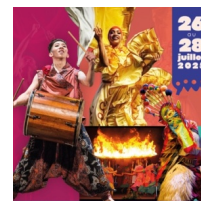
© Mairie de Tarascon sur Ariège